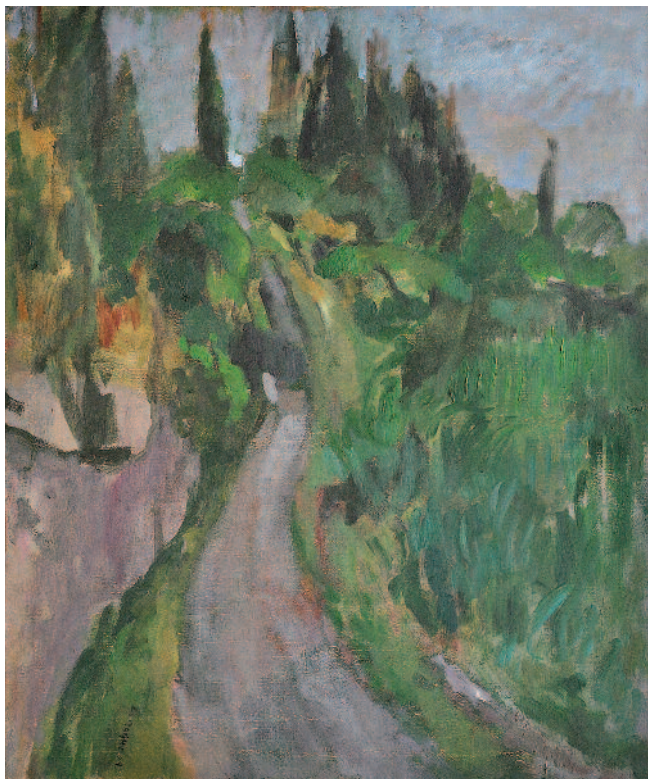
Era un sogno quell'andare , 2009 - olio su tela cm 50x60